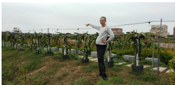
漁民水果餐的技術輔導