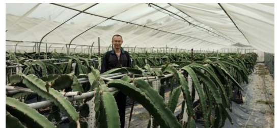
輔導上游產業金沙鎮大洋社區火龍果園